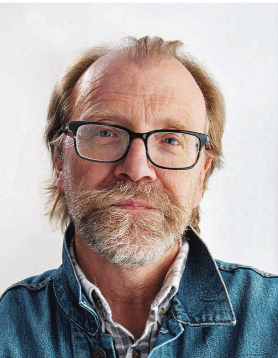
George Saunders.